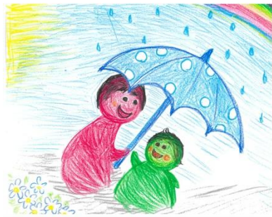
作: Y. M