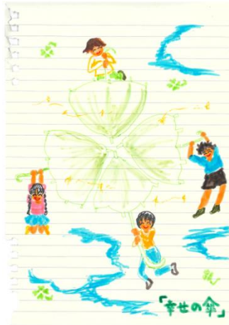
作: C. N