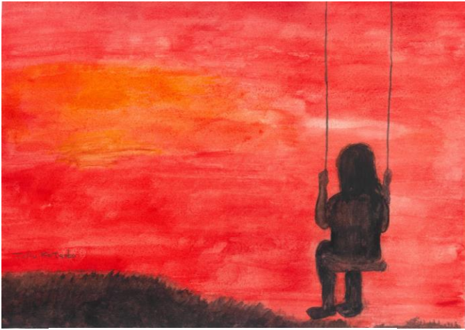
題名：大悲の子守唄 作：片岡 卓