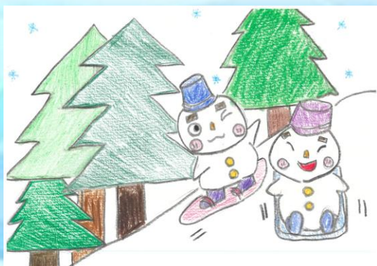
題名：あそび雪だるま 作：れみい

現在栄区は横浜市の中でも高齢化が急速に進んでおり、「親が高齢で子が精神障害の世帯（8050問題）」、「親亡き後のケース」、「引きこもり」等、精神障害を含めた精神保健福祉上の課題が増えています。地域の身近な福祉保健拠点であり、相談窓口である『地域ケアプラザ』と精神保健福祉の相談窓口である『生活支援センター』の連携はこれからも必要と考え、まず第一歩として、精神障害を知る・生活支援センターを知ってもらうところから勉強会を開催しました。