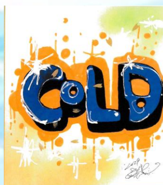
題名：表紙絵 作：sさん