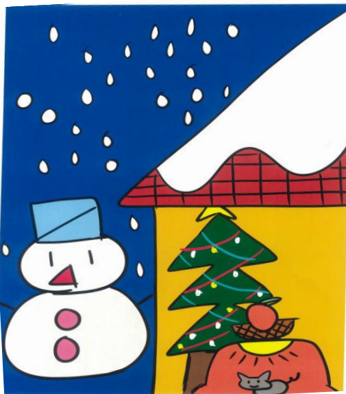
題名： 冬 作：ゆあぷー